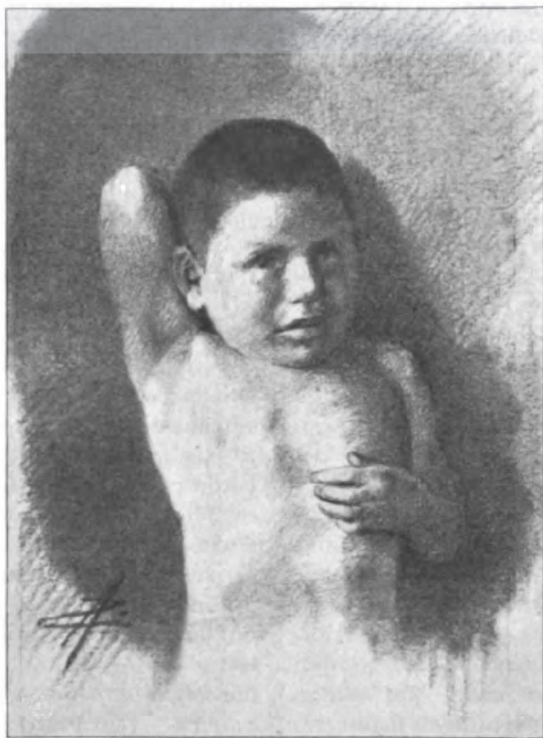
Figura 1: Uma criança Botocudo.

de tempos em tempos. O derramamento de sangue leva ao derramamento de sangue e este parece ser o lema de ambos os lados, quando uma atrocidade parece levar à outra. Ora os brancos, ora os selvagens buscam um acerto de contas baseado em infundáveis retaliações mútuas.