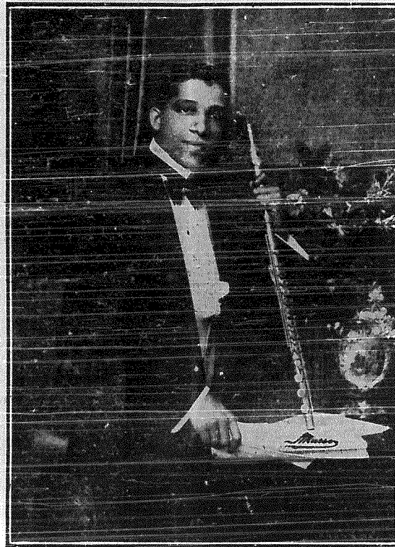
O maestro AGENOR BENS, que se acha entre nós

O exímio flautista brasileiro, maestro Agenor Bens, 1.º premio do Instituto Nacional de Musica, realizou na terça-feira ultima, no salão do club «Bohemios», perante selecta e numerosa assistencia, um magnifico concerto vocal e instrumental, no qual, alem do festejado artista brasileiro, tomaram parte alguns outros distinctos musicistas patricios.